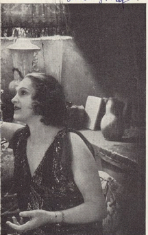
— Eftersom min, beløgende kun. — Ja, mestende kun.