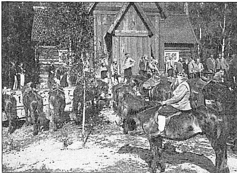
Utenfor kirken søndag form.