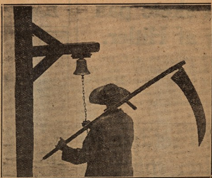
Manden med Leen ringer efter Færgemanden.

Hans sidste Værk „Vampyr“, der om nogle Uger udsendes herhjemme af Gloria-Film, vil sikkert vække lige saa stor Opsigt og Diskussion som „Jeanne d'Arc“.