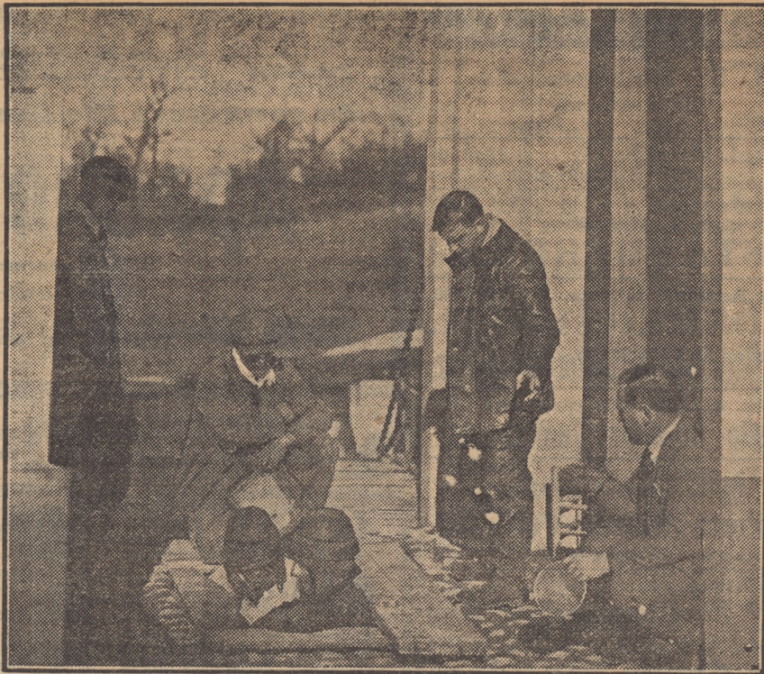
Der skal tages et Billede af Folkemængden, som styrter over en Vindebro. Instruktør Carl Th. Dreyer (staaende tilhøjre) dirigerer Operatøerne ned i en Forsænkning. Man lægger Mærke til, hvorledes Fotografen er beskyttet mod eventuelle Spark af de Statister, der skal løbe hen over dem.

en Engel eller en lille Fugl vilde gøre det.