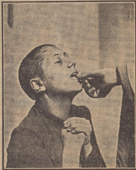
Jeanne d'Arc (Mlle Falconetti) modtager lige før sin Død den hellige Hostie.

— Jo, flere Gange, bl. a. for en halv Snes Aar siden i en amerikansk Film, hvori der var indlagt en rask lille Kærlighedshistorie mellem Jeanne og en engelsk Fangevogter.